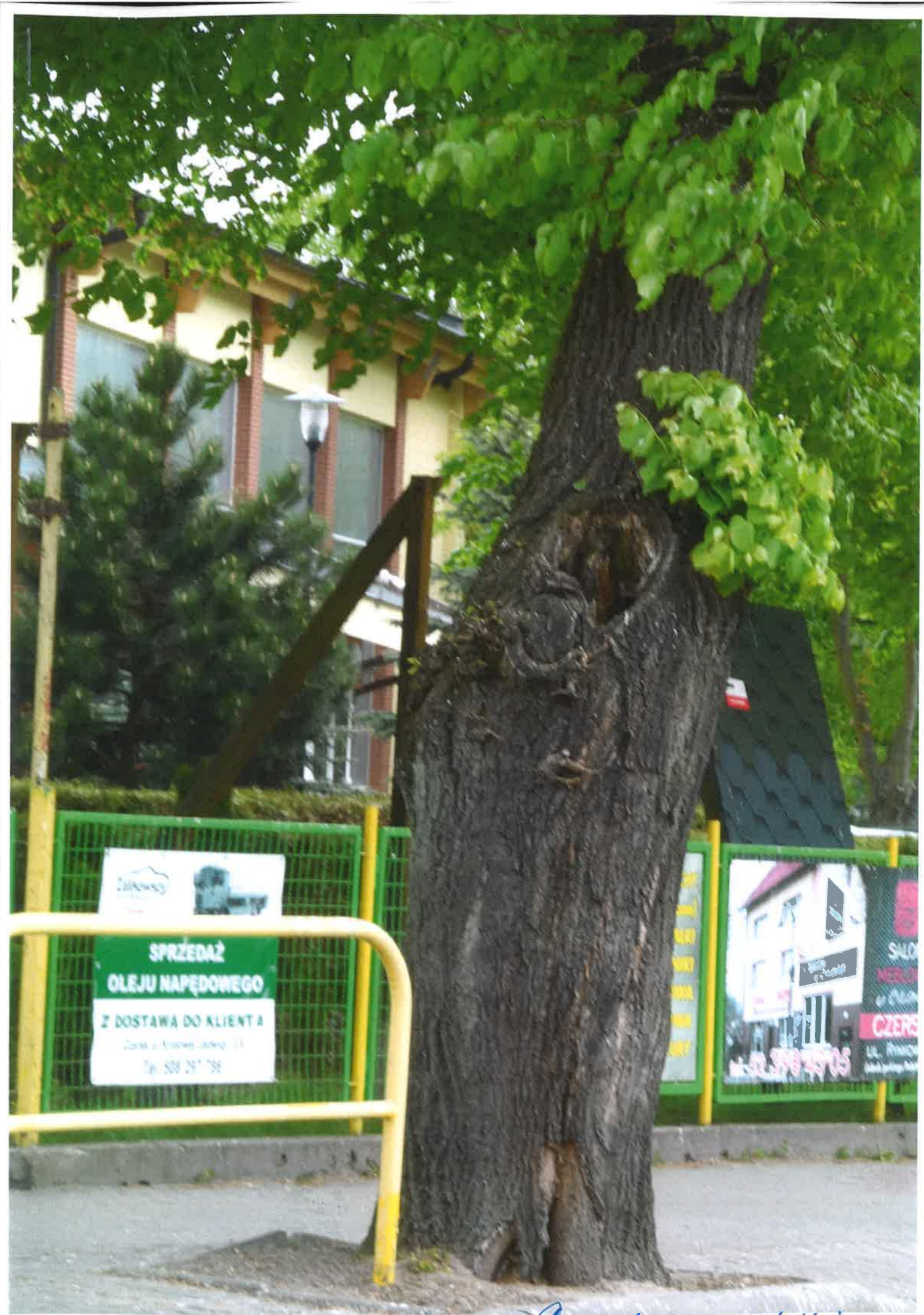
Drzewo nr. 1 na mapie przybafunaj.