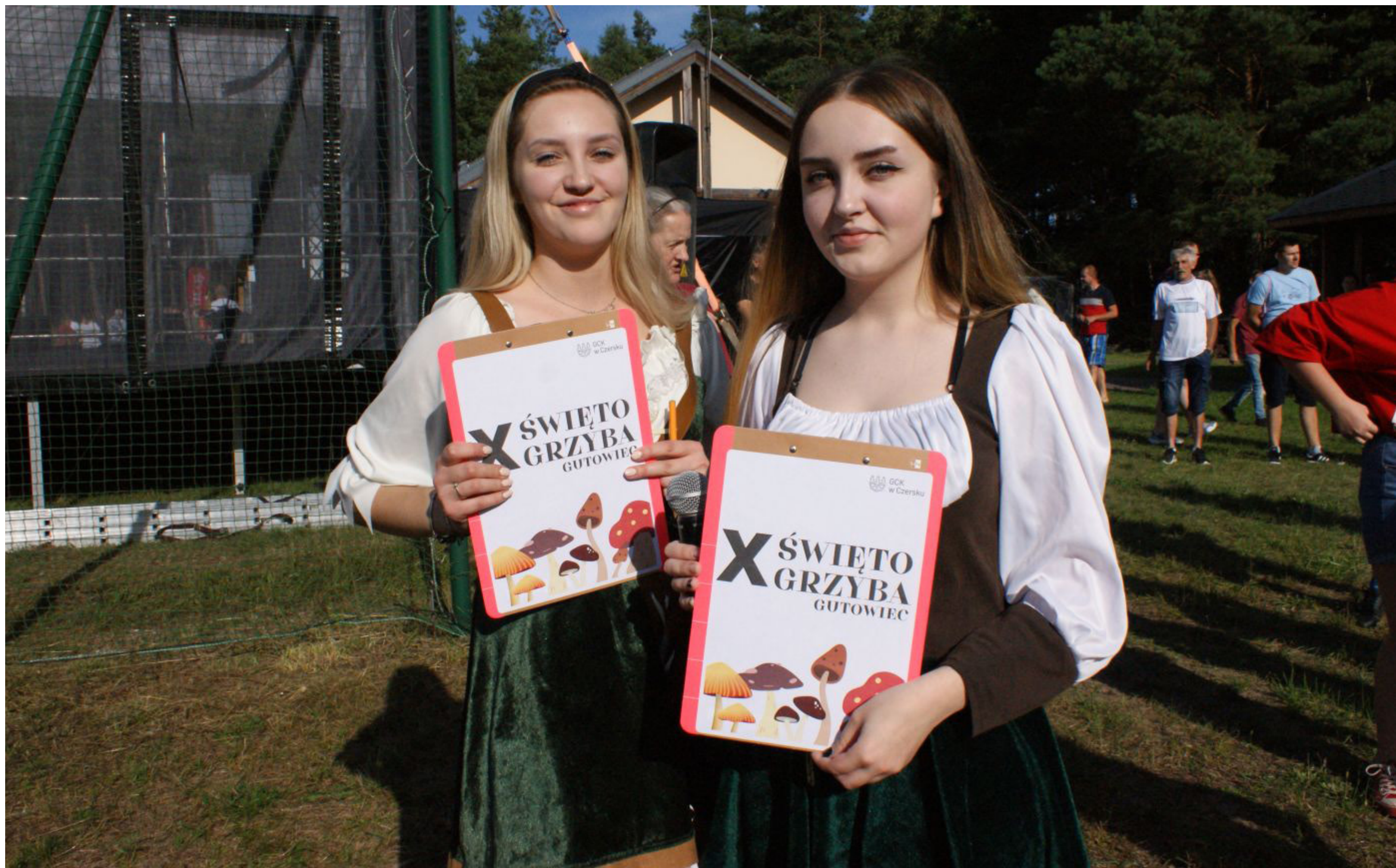
20 sierpnia | XI Święto Grzyba w Gutowcu Sołectwo Gutowiec, KGW Gutowianki/ GCK w Czersku